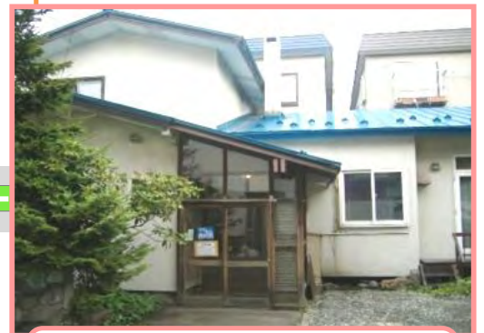
あお やね かいだ 青い屋根の2階建てです