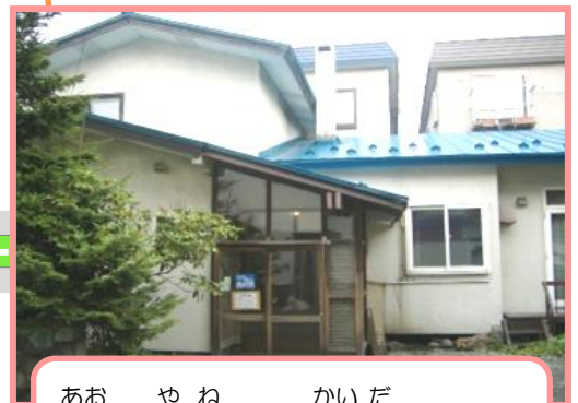
あお やね かいだ 青い屋根の2階建てです